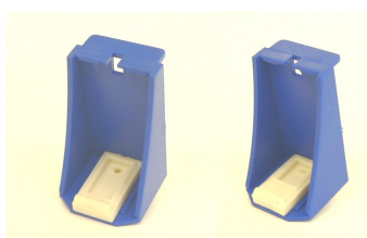
Refilltools für Lexmark 82/83/88 und 31/32/33/34/35